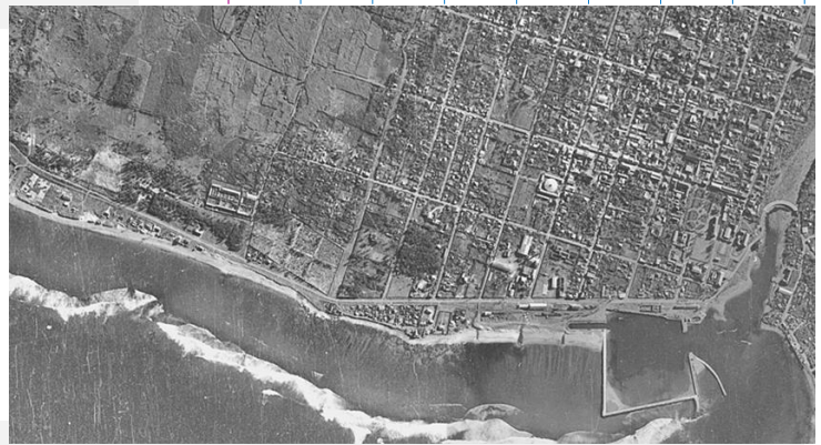
La Réunion en 1949

Cite 2 autres communes de l'île qui ont aussi un port.