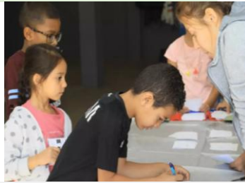
Conseil municipal des enfants de Saint-Pierre

Dans chaque commune, les habitants élisent des conseillers municipaux. Ceux-ci désignent un maire ou une maire. Les élections municipales ont lieu tous les 6 ans. La municipalité prend des décisions pour la commune ( construction de bâtiments, gestion des déchets, création d'une piste cyclable...).