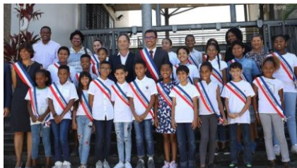
Un conseil municipal d'enfants

Dans chaque commune, les habitants élisent des conseillers municipaux. Ceux-ci désignent un maire ou une maire. Les élections municipales ont lieu tous les 6 ans. La municipalité prend des décisions pour la commune (constructions, déchets, aménagement d'une piste cyclable...)