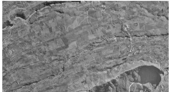
Photographie de La Réunion en 1949

Comment la canne était-elle acheminée jusqu'à l'usine ?