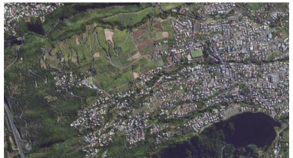
Photographie de La Réunion actuelle

Une commune: une ville ou un village dirigé par une ou une maire.